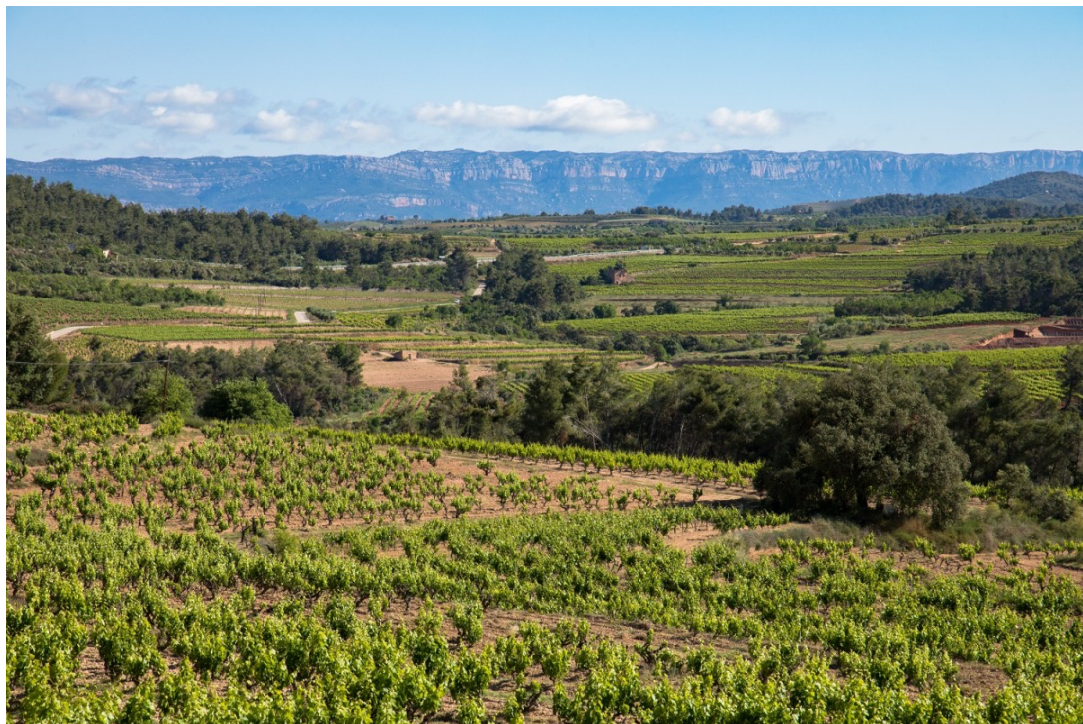
Imatge del paisatge de la DO Montsant | DO Montsant

( https://www.reusdigital.cat/pdf.php?id=90713&bdconf= )