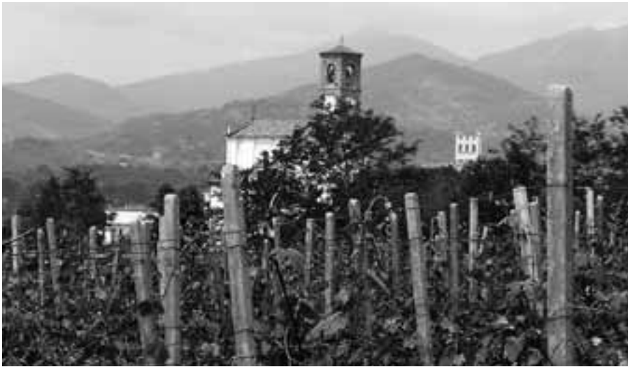
Weinland bei Tenute Sella, Lessona